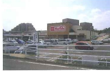
マックスバリュ (敷地内に、ジップドラッグ、しまむら、ドコモショップ等)