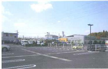
津メディカルモール (整形外科、内科、眼科、小児科)