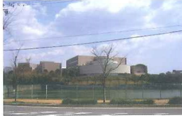
目の前に見える、三重県総合文化センターと三重県立図書館 (サンヒルズガーデン敷地内より撮影)